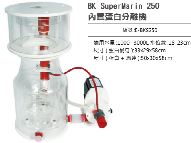
BK SuperMarin 250 內置蛋白分離機

編號 :E-BKS200 適用水量 :800~2000L 水位線 :18-23cm 尺寸 ( 蛋白桶身 ):29x24x62cm 尺寸 ( 蛋白 + 馬達 ):45x30x62cm