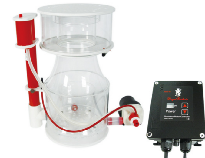
BK SuperMarin 300 內置蛋白分離機 RD3 可調速馬達 110V

編號 :E-BKS250-RD3 適用水量 :1000~3000L 水位線 :18-23cm 尺寸 ( 蛋白桶身 ):33x29x58cm 尺寸 ( 蛋白 + 馬達 ):50x30x58cm