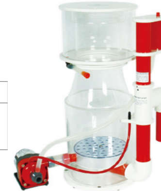
BK Deluxe 250 內置蛋白分離機