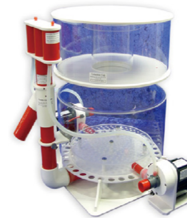
BK Deluxe 500 內置蛋白分離機