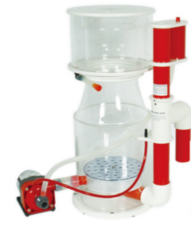
BK Deluxe 250 內置蛋白分離機 RD3 可調速馬達 110V