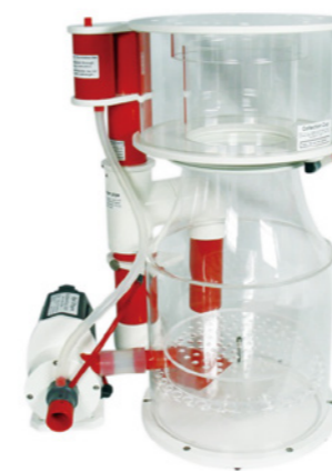
BK Deluxe 300 內置蛋白分離機