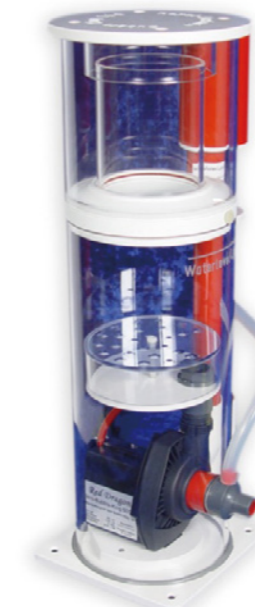
BK Mini 160 蛋白分離機

編號 :E-BKM160 適用水量 :200~500L 水位線 :13-30cm 尺寸 ( 蛋白 + 馬達 ):24x23x55.5cm