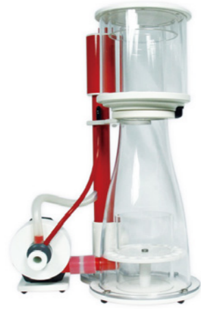
BK Double Cone 150 內置蛋白分離機