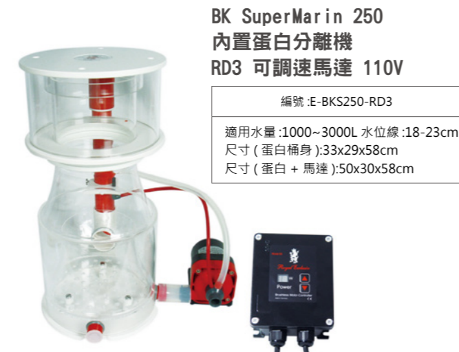
BK SuperMarin 250 內置蛋白分離機 RD3 可調速馬達 110V

編號 :E-BKS200-RD3 適用水量 :800~2000L 水位線 :18-23cm 尺寸 ( 蛋白桶身 ):29x24x62cm 尺寸 ( 蛋白 + 馬達 ):45x30x62cm