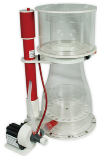
BK Double Cone 250 內置蛋白分離機