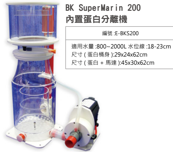
BK SuperMarin 200 內置蛋白分離機

編號 :E-BKS200 適用水量 :800~2000L 水位線 :18-23cm 尺寸 ( 蛋白桶身 ):29x24x62cm 尺寸 ( 蛋白 + 馬達 ):45x30x62cm