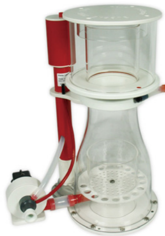
BK Double Cone 200 內置蛋白分離機