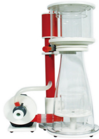
BK Double Cone 130 內置蛋白分離機