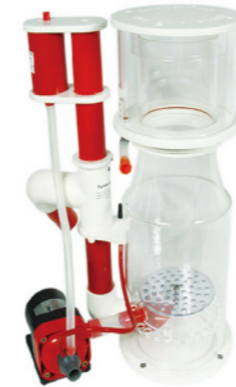
BK Deluxe 200 內置蛋白分離機