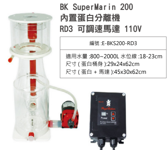
BK SuperMarin 200 內置蛋白分離機 RD3 可調速馬達 110V

編號 :E-BKS250 適用水量 :1000~3000L 水位線 :18-23cm 尺寸 ( 蛋白桶身 ):33x29x58cm 尺寸 ( 蛋白 + 馬達 ):50x30x58cm