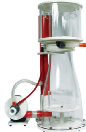
BK Double Cone 180 內置蛋白分離機