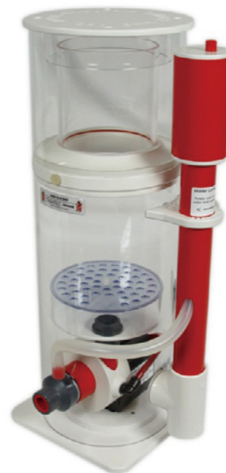
BK Mini 180 蛋白分離機

編號 :E-BKM160 適用水量 :200~500L 水位線 :13-30cm 尺寸 ( 蛋白 + 馬達 ):24x23x55.5cm