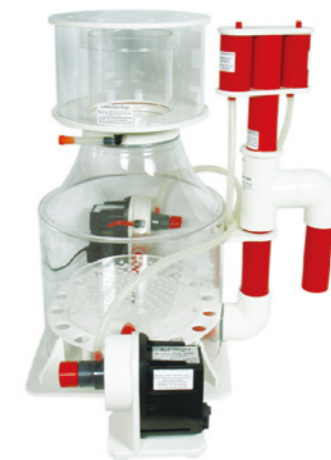
BK Deluxe 400 內置蛋白分離機